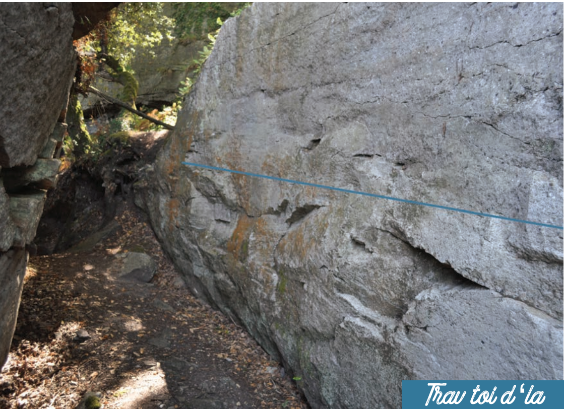
Trav toi d'la